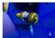
Vstup externí vody