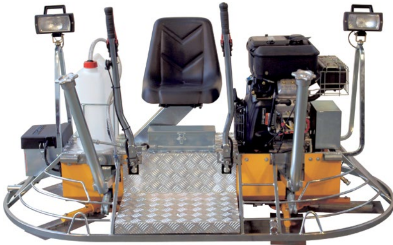
Hladička OL 90